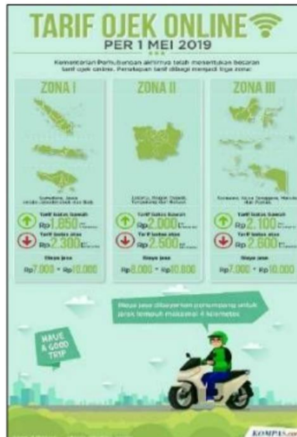
Gambar 2: Tarif Ojek Online Per 1 Mei 2019

Setelah resmi ditetapkan, para pengemudi ojek online merasa setuju dan puas dengan penetapan aturan baru tersebut. Berdasarkan wawancara, pengemudi ojek online menyebutkan bahwa tarif naik karena BBM yang sudah naik, bahkan para pengemudi ojek online merasa tarif ojek online saat ini masih kurang mencukupi untuk memenuhi kehidupan sehari-hari karena kondisi keuangan sehari-hari yang terus meningkat, serta harga BBM yang semakin hari kian naik. Namun, penetapan tarif ini berdampak pada menurunnya orderan dari customer. Para customer merasa keberatan dan berharap tarif ojek online kembali turun.