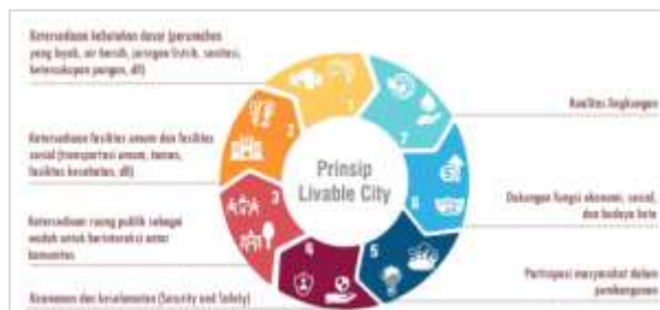
Gambar 1. Prinsip-prinsip livable city .

( http://Sim.Ciptakarya.Pu.Go.Id/Kotabaru/Site/Konseptkotabaru/20 ," n.d.).