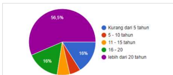
Gambar 4. Durasi waktu tinggal responden di Kota Kupang.

Kota-kota di Indonesia yang dinilai oleh IAP didominasi oleh kota-kota besar yang dianggap penting (Kristarani, Setiawan, dan Marsoyo 2017). Sedangkan Kota Kupang yang pada tahun 2019 berpenduduk sebanyak 434.972 jiwa (BPS Kota Kupang 2020) dapat digolongkan ke dalam kota sedang atau menengah. Hal ini sesuai ketentuan dimana kota berpenduduk 100.000-500.000 jiwa digolongkan sebagai kota sedang (Peraturan Pemerintah RI No. 26 Tahun 2008 Tentang Rencana Tata Ruang Wilayah Nasional 2008).