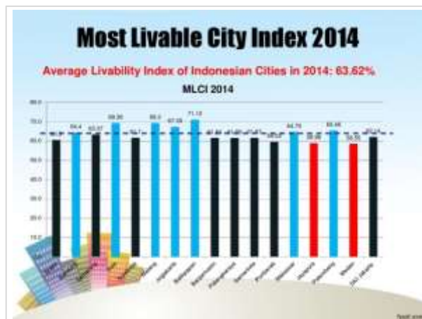
Gambar 2. Grafik indeks layak hunian kota-kota di Indonesia tahun 2014

Hasil penilaian tingkat layak huni kota-kota di Indonesia dirilis oleh IAP dengan tajuk The Most Livable City in Indonesia (MLCI). Pada tahun 2014, IAP melakukan survey di 14 kota di seluruh Indonesia yang secara keseluruhan melibatkan 1400 responden atau kira-kira 100 responden untuk setiap kota (Ikatan Ahli Perencanaan Indonesia 2014). Dalam penentuan respondennya, IAP menggunakan teknik stratified random sampling berdasarkan kelompok umur. Berdasarkan hasil survey tersebut ditentukan tujuh kota dengan indeks layak huni tertinggi, yaitu berturut-turut adalah: Balikpapan, Solo, Malang, Yogyakarta, Palembang, Makasar, dan Bandung.