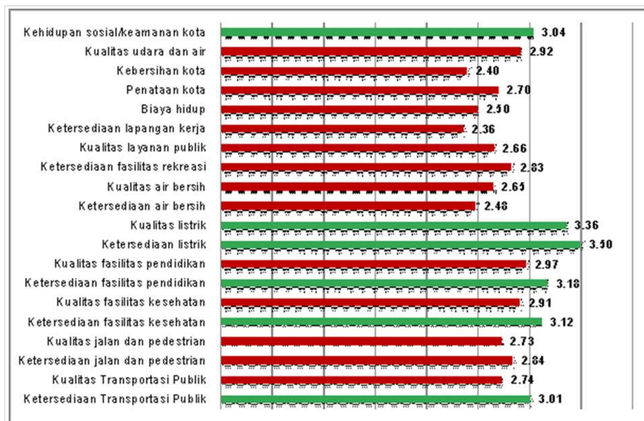
Gambar 5. Grafik hasil penilaian responden untuk indikator-indikator Kota Layak Huni