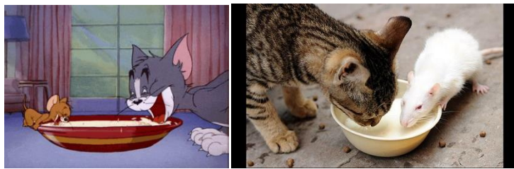
Gambar 5. Keakraban Kucing dan Tikus

Salah satunya dengan anggapan bahwa kucing dan tikus tidak selamanya bermusuhan, adakalanya mereka dapat hidup dengan damai. Kondisi demikian menurut peneliti dapat diwakili dengan gambar berikut: