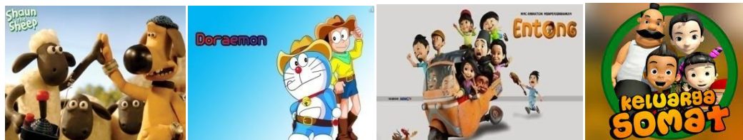
Gambar 1. Serial Kartun

Penampilan tokoh kartun tersebut juga dibuat menarik bahkan tidak jarang menggemaskan. Kehadiran tokoh kartun pada akhirnya membuat serial kartun yang mereka bintang menjadi terkenal dan selalu ditunggu-tunggu kehadirannya. Tidak sampai situ, melihat besarnya animo masyarakat terhadap sebuah kartun, tidak jarang juga dibuatkan dalam bentuk miniatur atau bahkan mainan. Selain itu, serial kartun yang ditayangkan di televisi beberapa diantaranya juga dibuatkan dalam bentuk komik sehingga semakin dekat dengan masyarakat. Berikut ini beberapa contoh serial kartun yang masih bisa disaksikan hingga saat ini.