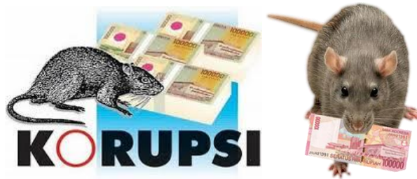
Gambar 4. Ilustrasi Tindak Kejahatan Korupsi

Walaupun tikus merupakan makhluk yang memiliki bentuk dan ukuran tubuh yang kecil namun, tidak jarang masyarakat juga menyematkan sosok tikus pada diri seseorang yang melakukan suatu tindak kejahatan besar, korupsi misalnya. Sebagaimana nampak pada gambar berikut.