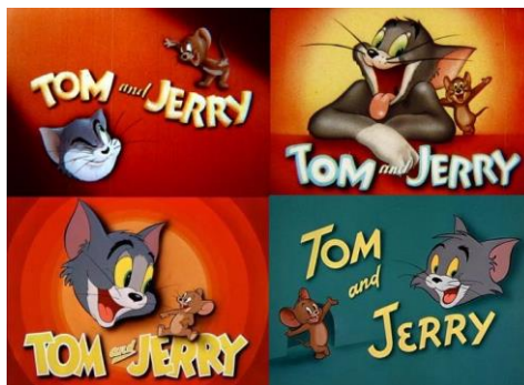
Gambar 2. Serial Kartun Tom and Jerry

Banyak serial kartun yang masih bisa disaksikan hingga saat ini. Dari sekian banyak kartun yang masih bisa disaksikan sampai tersebut dan memiliki tokoh yang mudah dikenal adalah serial kartun Tom and Jerry . Tom and Jerry merupakan sebuah serial animasi (kartun, pen.) Amerika Serikat hasil produksi MGM (Metro-Goldwyn-Mayer) yang bercerita tentang sepasang kucing (Tom) dan tikus (Jerry) yang selalu bertengkar ( www.intipsejarah.com ). Serial kartun Tom and Jerry , selain dapat disaksikan melalui media televisi, serial ini juga bisa disaksikan melalui layar lebar, VCD, DVD bahkan karena perkembangan teknologi baru, serial kartun Tom and Jerry juga bisa disaksikan melalui internet.