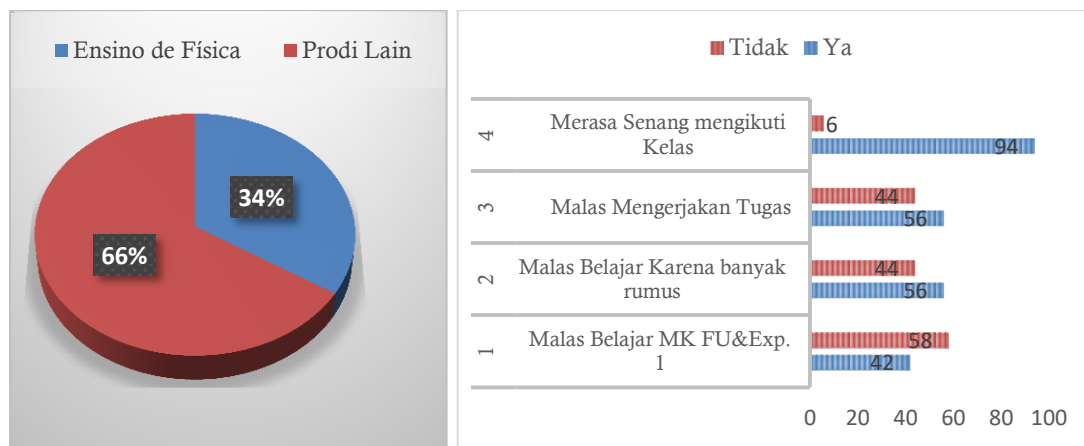
Gambar 1. Data Sebaran Penempatan Mahasiswa Baru (kiri), Persentase Minat Belajar Mahasiswa Angkatan 2023 Prodi Ensino De Fisica (kanan)

kesulitan belajar yang bukan hanya mempengaruhi hasil belajar mahasiswa, tetapi juga dapat mempengaruhi minat, keterampilan serta dapat merugikan mahasiswa dan karirnya di masa mendatang. Hal ini sejalan dengan hasil penelitiannya Perta (2021) yang ia simpulkan bahwa hasil belajar peserta didik tidak optimal karena jurusan yang ditempati tidak sesuai dengan minat peserta didik sehingga ia mengalami kesulitan selama mengikuti proses belajar di jurusan Fisika, Kimia, Biologi dan Matematika.