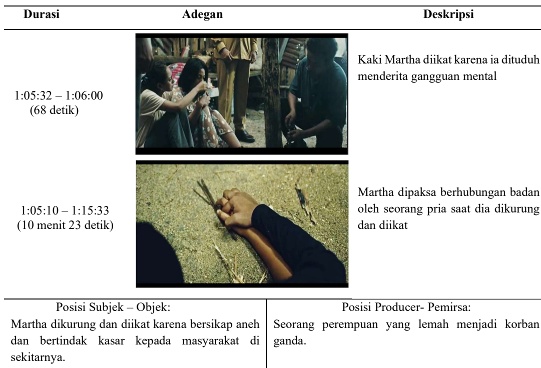
Tabel 2, Adegan kedua yang menunjukkan Kekerasan Seksual terhadap (Martha)