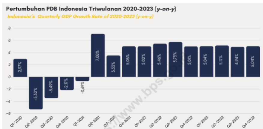
Tabel 2. Pertumbuhan PDB Indonesia Triwulan 2020-2023

Sementara itu, defisit anggaran yang sempat membengkak pada masa pandemi juga berhasil ditekan secara bertahap. Pada tahun 2020, defisit anggaran mencapai Rp1.091,4 triliun atau 6,09% terhadap Produk Domestik Bruto (PDB). Namun, seiring dengan membaiknya penerimaan negara dan terkendalinya pengeluaran, defisit menurun menjadi Rp507,8 triliun atau setara 2,29% dari PDB pada tahun 2024. Penurunan ini mencerminkan komitmen pemerintah dalam menjaga keberlanjutan fiskal sekaligus tetap mendukung pemulihan ekonomi nasional di tengah tantangan global.