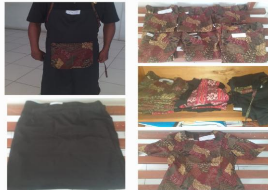
Gambar 5. Hasil Produk

diberikan. Adapun kriteria penilaian meliputi kedisiplinan dan kehadiran peserta, kemampuan praktik menjahit, pemahaman materi, serta kemampuan menyelesaikan tugas atau produk sesuai standar yang telah ditetapkan.”