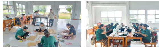
Gambar 2. Keaktifan peserta pada saat pelatihan