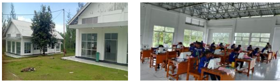
Gambar 3. Sarana dan Prasarana

secara mandiri agar tetap memenuhi standar mengajar. Selain itu, UPTD BLK telah memiliki sarana dan prasarana yang cukup memadai, seperti gedung pelatihan, peralatan menjahit, dan bahan praktik”.