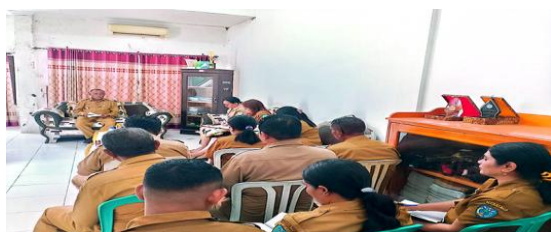
Gambar 1. Rapat Bersama Perencanaan Program Pelatihan

Sekretaris Daerah (Sekda), hingga Dinas terkait. Mereka menetapkan anggaran pelatihan berdasarkan usulan dari lembaga pelaksana. Sementara itu, untuk anggaran yang bersumber dari APBN biasanya disalurkan melalui Balai Pelatihan Vokasi dan Produktivitas (BPVP) Lombok Timur. BPVP akan meminta lembaga pelaksana untuk menyusun daftar usulan pelatihan terlebih dahulu. Setelah daftar tersebut dikirim, akan diadakan rapat bersama dengan seluruh UPTD di Balai Nusa Tenggara. Berdasarkan hasil rapat tersebut, paket pelatihan akan ditetapkan sesuai dengan usulan yang telah diajukan”.