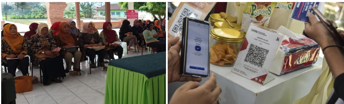
Gambar 3. Workshop dan Pelatihan Penggunaan QRIS (kiri) dan Implementasi Sistem Digitalisasi Transaksi Zakat Produktif (kann)

Setelah sosialisasi, pelaku UMKM milenial diberikan pelatihan teknis mengenai cara menggunakan QRIS dalam transaksi usaha. Pelatihan ini mencakup instalasi aplikasi pembayaran digital, cara scan QR code, pencatatan transaksi secara digital, serta pengelolaan keuangan berbasis digital. Pendampingan dilakukan secara langsung oleh tim fasilitator yang terdiri dari mahasiswa dan dosen yang berpengalaman dalam bidang teknologi informasi dan ekonomi syariah. Pendampingan ini juga menargetkan peningkatan literasi digital dan keuangan agar UMKM mampu memanfaatkan teknologi ini secara optimal dan mandiri.