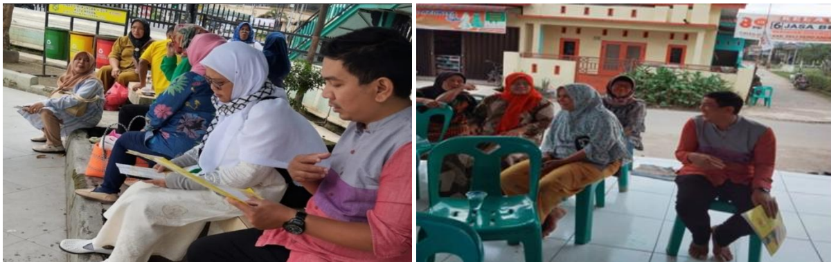
Gambar 2. Identifikasi dan Pemilihan Sasaran (kiri) dan Sosialisasi dan Edukasi Digitalisasi Zakat Produktif (kanan)

keuangan digital menjadi fokus utama agar pelaku UMKM dapat memahami cara mengelola keuangan usaha secara digital dan aman.