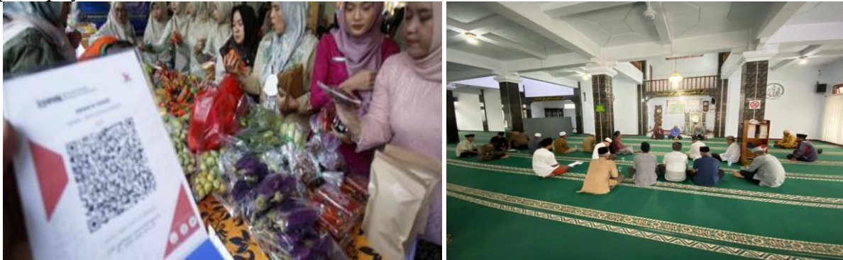
Gambar 4. Pendampingan dan Monitoring (kiri) dan Sinergi dan Penguatan Peran Masjid sebagai Pusat Pemberdayaan Ekonomi (kanan)

strategi pemasaran digital. Pendampingan juga mencakup edukasi pengelolaan keuangan syariah agar penerima dana mampu mencatat dan mengelola transaksi usaha secara transparan dan sesuai prinsip syariah.