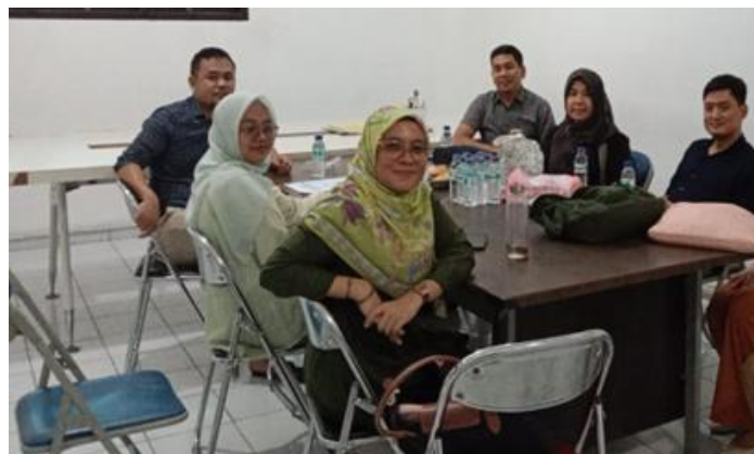
Gambar 5. Monitoring, Evaluasi, dan Pengembangan Berkelanjutan

Kegiatan tidak berhenti pada implementasi awal, melainkan dilanjutkan dengan monitoring dan evaluasi secara berkala untuk mengukur dampak pemberdayaan ekonomi terhadap kesejahteraan UMKM milenial. Evaluasi ini mencakup aspek pertumbuhan usaha, peningkatan pendapatan, pengelolaan keuangan digital, serta kepuasan pelaku UMKM terhadap sistem digitalisasi zakat produktif. Hasil evaluasi digunakan sebagai dasar pengembangan program lebih lanjut, termasuk pengembangan produk UMKM, perluasan jaringan pemasaran digital, dan peningkatan kapasitas sumber daya manusia di desa. Pendekatan ini memastikan keberlanjutan dan skalabilitas pemberdayaan ekonomi berbasis digital dan syariah di Desa Klambir V Kebun.