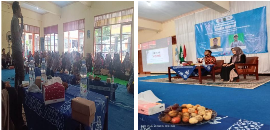
Gambar 1. Kegiatan Penyampaian Materi serta Diskusi Parenting

Kegiatan pengabdian kepada masyarakat ini merupakan kegiatan kolaborasi yang dilaksanakan oleh tim dosen dari UIN K.H. Abdurrahman Wahid (Gusdur) Pekalongan dan SD Muhammadiyah 2 Noyontaan Kota Pekalongan. Kegiatan dilaksanakan pada Sabtu, 15 Februari 2025, pukul 09.00-12.00 WIB dengan bertempat di ruang pertemuan SD Muhammadiyah 2 Noyontaan Pekalongan dan dihadiri oleh para wali murid yang ingin meningkatkan pemahaman mereka mengenai pola asuh berbasis rumah ( parenting from home ).