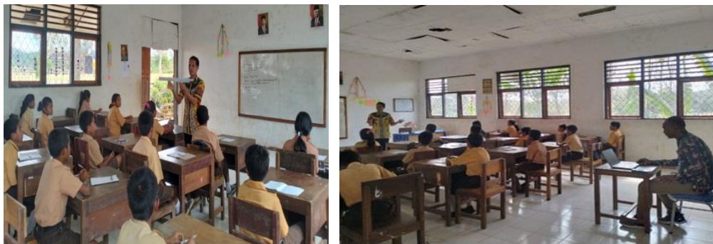
Gambar 4. Aktivitas Pembelajaran di Kelas dengan Interaksi Aktif antara Guru dan Siswa

Selain itu, hasil observasi kegiatan pembelajaran di kelas menunjukkan adanya peningkatan signifikan dalam hal interaksi antara guru dan siswa. Siswa tampak lebih aktif dalam pembelajaran, dan hasil wawancara siswa menunjukkan bahwa mereka merasa lebih tertarik dengan materi pelajaran yang disampaikan. Guru berusaha meningkatkan manajemen kelas dengan menambahkan teknik yang lebih efektif dan menciptakan lingkungan pembelajaran yang lebih baik. Mereka tidak menyerah pada keterbatasan fasilitas, seperti ruang kelas yang terbatas atau kurangnya media pembelajaran, tetapi untuk memastikan bahwa suasana kelas tetap memberikan dukungan pembelajaran terbaik, mereka terus berupaya untuk kreatif sehingga mampu beradaptasi dengan perkembangan dunia pendidikan terbaru. Upaya ini menunjukkan kreativitas dan komitmen guru dalam mengatasi masalah pembelajaran dengan tujuan agar prestasi belajar siswa dapat meningkat.