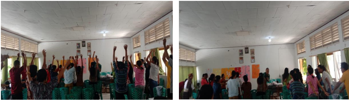
Gambar 5. Pertemuan Komunitas Belajar Guru atau Sesi Perencanaan untuk Kegiatan Selanjutnya

hanya memberikan dampak positif jangka pendek, tetapi juga memiliki potensi untuk berkelanjutan dan memberikan dampak yang lebih luas dalam meningkatkan kualitas pendidikan di Kabupaten Sabu Raijua