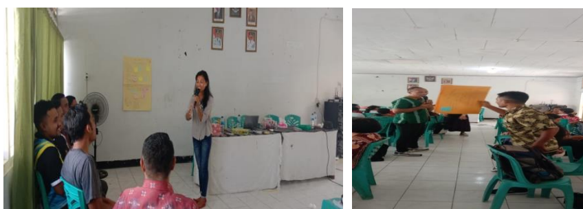
Gambar 3. Guru dalam Diskusi Kelompok atau Sesi Berbagi Pengalaman

Selain itu, kolaborasi yang semakin erat ini membantu guru berkembang secara profesional karena mereka dapat belajar dari praktik yang baik dari rekan sejawat mereka dan mendapatkan masukan yang bermanfaat untuk meningkatkan kualitas pengajaran mereka. Dengan lebih banyak kesempatan untuk berbicara dan bertukar ide, guru dapat berkembang secara lebih efektif dalam pekerjaan mereka, memperluas wawasan mereka, dan meningkatkan kinerja dan kualitas pembelajaran siswa. Secara keseluruhan, data ini menunjukkan bahwa kegiatan berbagi praktik baik dan kolaborasi antar guru dapat memperkuat komunitas profesi guru, menciptakan lingkungan yang mendukung inovasi dalam pengajaran, dan berkontribusi pada peningkatan kualitas pembelajaran siswa (McLaughlin & Talbert, 2008).