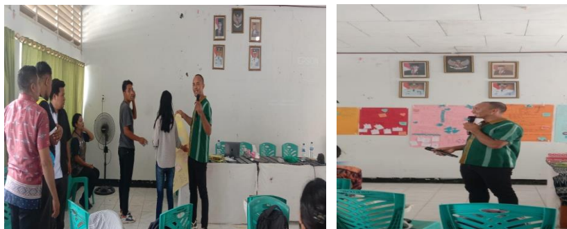
Gambar 2. Narasumber Memaparkan Materi tentang Peningkatan Pengetahuan dan Keterampilan Guru dalam Pembelajaran

Salah satu sesi pelatihan yaitu materi tentang metodologi dan strategi pembelajaran menekankan pada cara-cara terbaru dalam mengajar yang dapat diterapkan di daerah dengan keterbatasan fasilitas (Blanchard & Thacker, 2023). Materi ini membekali para guru dengan keterampilan praktis dalam merancang dan melaksanakan pembelajaran yang efektif, meskipun di lingkungan dengan fasilitas yang terbatas. Hasil survei dan evaluasi yang dilakukan di akhir kegiatan menunjukkan bahwa 87% peserta merasa lebih percaya diri dalam mengimplementasikan teknik-teknik pengajaran baru yang mereka pelajari. Hal ini menandakan bahwa kegiatan ini berhasil memberikan pengetahuan dan keterampilan yang berguna bagi guru-guru di Kabupaten Sabu Raijua.