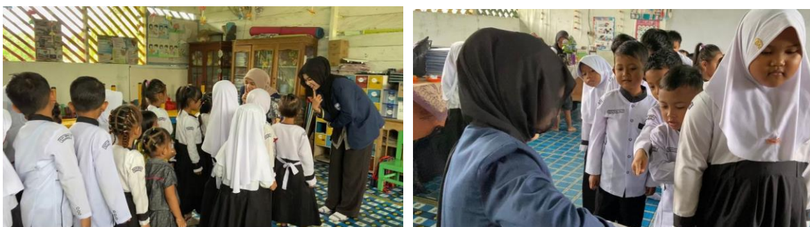
Gambar 7. Kegiatan Sukarelawan Mengajar di Sekolah

Mitra kami merupakan salah satu sekolah dengan kondisi fasilitas belajar mengajar saat ini, masih tergolong kurang memadai termasuk dari segi tenaga pengajar. Sekolah tersebut berdiri pada tahun 1996, pada awal pendiriannya tidak dikhususkan untuk TK, melainkan hanya berupa pra-sekolah desa (Pusat Layanan Universitas Teknokrat Indonesia, 2024). TK ini memiliki 32 murid dengan 2 sesi sekolah, sesi pagi dan juga sesi siang. Di TK ini, hanya memiliki satu orang guru dan satu kepala sekolah yang juga bertindak sebagai tenaga pengajar. Jumlah tenaga pengajar yang minim membuat kepala sekolah harus turun tangan menjadi guru, sehingga mengakibatkan kurangnya tingkat pelayanan pendidikan di TK tersebut. Tim pengabdian akan mengakomodasi kekurangan tenaga pengajar tersebut dengan terjun langsung membantu proses belajar mengajar di ruang kelas sebagai tenaga bantu pengajar.