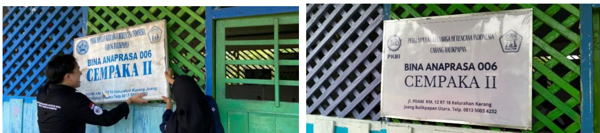
Gambar 4. Revitalisasi Papan Nama Sekolah

Papan nama TK adalah identitas dan penanda sekolah. Papan nama berfungsi sebagai penunjuk atau informasi bahwa bangunan yang dituju adalah benar TK Cempaka II, sehingga sekolah ini bisa dikenali lokasinya dan menjadi papan penunjuk informasi bagi masyarakat. Hal tersebut bisa juga menjadi daya tarik bagi sekolah dalam memperoleh peserta didik baru.