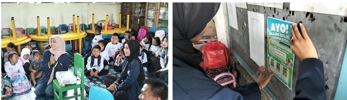
Gambar 6. Edukasi Kelola Sampah

Melihat keadaan sebelumnya, dimana tidak adanya tempat sampah, maka terdapat kemungkinan bahwa anak-anak TK tersebut menjadi kurang aware dengan kebersihan lingkungan sekolah. Berdasarkan hasil pengamatan tersebut, maka tim menyelenggarakan sosialisasi tentang pentingnya pengadaan bak sampah dan pentingnya menjaga kebersihan untuk menanamkan perasaan peduli terhadap kebersihan dari usia dini.