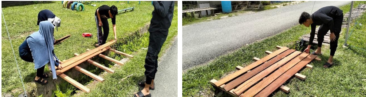
Gambar 2. Pembuatan Jembatan

keselamatannya lebih terjamin. Pada pelaksanaan pembangunan, kami menggunakan material kayu ulin karena lebih kokoh dan awet dibandingkan dengan jenis kayu lainnya.