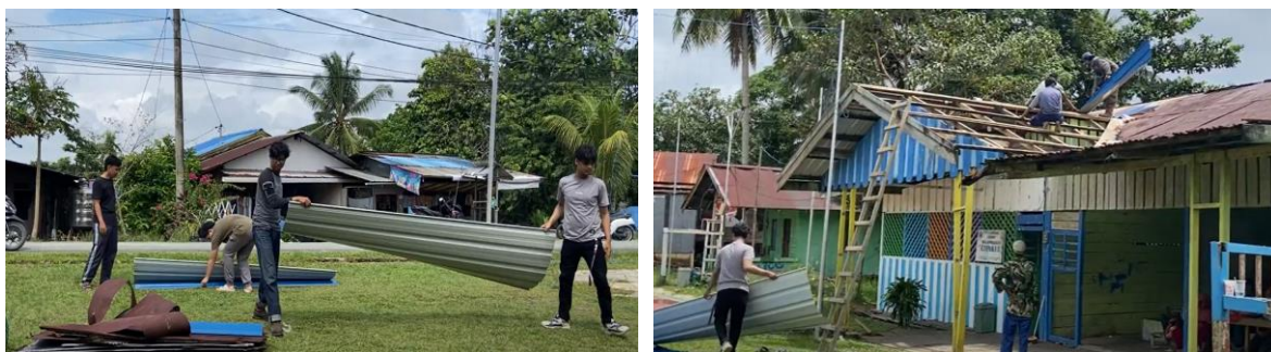
Gambar 1. Renovasi Atap Sekolah

Setelah atap sekolah sudah dilakukan renovasi, hal tersebut memberikan dampak yang sangat besar bagi aktivitas belajar mengajar. Kondisi kelas tidak lagi mengalami kebocoran pada saat hujan sehingga tercipta suasana belajar yang aman, guru juga merasa nyaman dalam menyampaikan pembelajaran dan siswa menjadi termotivasi dalam menuntut ilmu.