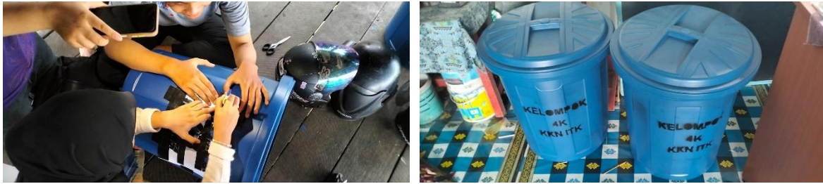
Gambar 5. Pengadaan Tempat Sampah