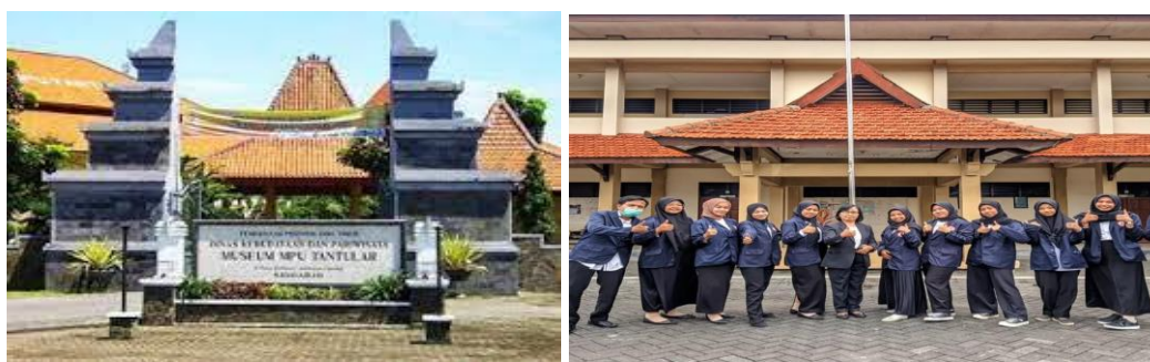
Gambar 2. Gerbang Utama Museum Mpu Tantular (kiri) Bersama Mahasiswa Seluruh Peserta (kanan)

Untuk memberikan gambaran yang lebih jelas tentang hasil dan pembahasan kegiatan pengabdian masyarakat di museum Mpu Tantular, berikut adalah hasil yang terjadi dari kegiatan tersebut, serta pembahasan terkait dampak dan implikasi dari pengabdian masyarakat yang dilakukan oleh museum tersebut: