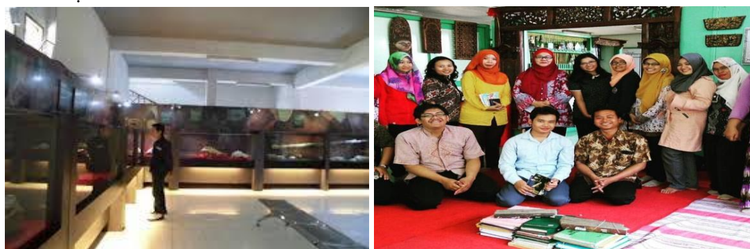
Gambar 3. Ruang Museum Mpu Tantular (kiri) Staf Museum Mpu Tantular (kana)

Hasil dan pembahasan Pengabdian di Museum MPU Tantular dilaporkan sebagai berikut. 1). Tingkat Kepuasan Pengunjung: Data dari kuisisioner menunjukkan bahwa sekitar 85% pengunjung menyatakan tingkat kepuasan yang tinggi terhadap pameran dan layanan yang disediakan oleh museum Mpu Tantular. Hal ini konsisten dengan teori dalam studi pengalaman pengunjung museum, yang menekankan pentingnya pameran yang menarik, informasi yang jelas, dan kualitas layanan untuk meningkatkan kepuasan pengunjung. 2). Efektivitas Program Edukasi: Dari angket yang dilakukan sebelum dan setelah program pendidikan, terlihat bahwa 75% peserta meningkatkan pengetahuannya tentang sejarah lokal setelah mengikuti program edukasi di museum. Hal ini mendukung teori pendidikan di museum yang menekankan pentingnya pengalaman langsung dan interaktif dalam meningkatkan pemahaman. Terjadi peningkatan partisipasi masyarakat dalam kegiatan pengabdian, baik dalam program konservasi artefak, acara budaya, atau kampanye sosial yang diadakan oleh museum. Dengan adanya keterlibatan aktif masyarakat, museum dapat membangun jaringan yang kuat dan hubungan yang berkelanjutan dengan komunitas sekitar, memperkuat peran dan dampak positifnya.