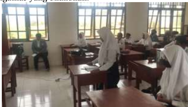
Gambar 1. Pemberian Materi

Tujuan dari pelaksanaan pre-adalah untuk mengukur tingkat pengetahuan awal remaja tentang kesehatan jiwa emosional dan tujuan dari post-test untuk mengukur pengetahuan remaja setelah diberikan materi kesehatan jiwa emosional. Setelah pengukuran ini dilakukan analisis untuk mengujur keberhasilan terhadap adanya peningkatan pengetahuan tentang kesehatan jiwa emosional kegiatan pengmas yang dilakukan.