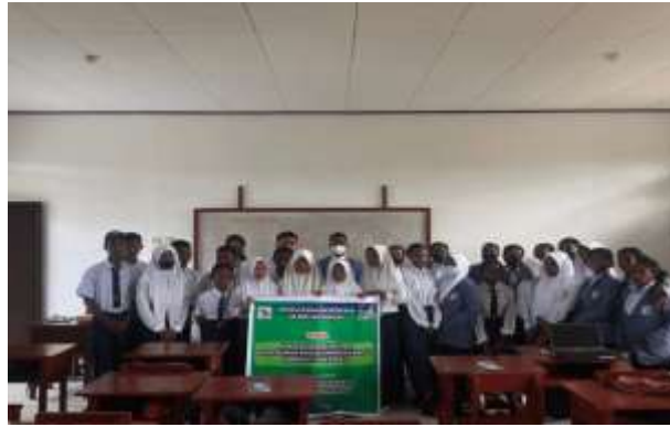
Gambar 2. Sesi Kebersamaan

Diakhir kegiatan dilakukan dokumentasi bersama dengan tim, guru dan remaja SMP Emeyodere Kota Sorong. Diakhir kegiatan, tim pengabdian kepada masyarakat memberikan himbauan apabila remaja mengalami emosional yang tidak dapat terkendali seperti perasaan cemas berlebihan, ketakutan berlebihan atau bahkan perasaan marah dan jengkel yang berlebihan dapat dapat ke kampus STIKES Papua untuk konseling atau berdiskusi bersama dengan tim dosen keperawatan jiwa yang ada di kampus.