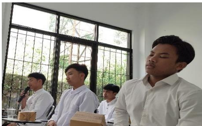
Gambar 3. Sosialisasi dan Wawancara