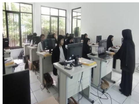
Gambar 5. Uji Kompetensi

Di akhir sesi pelatihan, dilaksanakan uji kompetensi untuk mengetahui tingkat pemahaman dari masing-masing peserta. Peserta diuji melalui praktek dan tulis yang mana dari hasil uji kompetensi tersebut seluruh peserta dinyatakan layak dengan nilai peserta terendah 79 (B) dan tertinggi 90 (A).