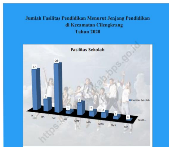
Gambar 1. Jumlah Fasilitas Sekolah di Kecamatan Cilengkrang Tahun 2021. (Badan Pusat Statistik Kabupaten Bandung, 2021)

Indikator keberhasilan pembangunan manusia salah satunya adalah kemajuan dalam pendidikan. Apabila pembangunan manusia baik maka potensi-potensi yang ada di wilayah sekitarnya akan ikut baik pemanfaatannya. Salah satu potensi yang cukup besar di wilayah Kecamatan Cilengkrang adalah potensi wisata mengingat Kecamatan Cilengkrang berada di ketinggian 500 – 1800 m dpl maka potensi wisata yang ada di wilayah ini meliputi wisata yang berkaitan dengan ketinggian seperti pegunungan, curug dan perkebunan (Badan Pusat Statistik Kabupaten Bandung, 2021).