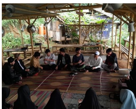
Gambar 4. Kegiatan Pelatihan