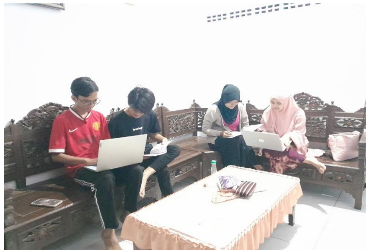
Gambar 2. Diskusi dan Koordinasi Kelompok.

Tahap selanjutnya kami melakukan persiapan pada tempat dan melakukan pengecekan kembali pada peralatan yang dibutuhkan kemudian melanjutkan pada kegiatan Pembuatan NIB, pelaksanaan dapat dilakukan pada Kelurahan Klampok dan ada juga yang kami datangi di tempat pengelola UMKM. Pembuatan NIB dilakukan dengan cara membuat akun website OSS dengan mengisi data-data perusahaan, pemegang saham, kepemilikan modal, nilai investasi dan rencana penggunaan tenaga kerja, termasuk tenaga kerja asing. Jika pelaku usaha menggunakan tenaga kerja asing, maka pelaku usaha menyetujui pernyataan penunjukan tenaga kerja pendamping serta akan menyelenggarakan pendidikan dan pelatihan atau dengan output surat pernyataan, selanjutnya setelah melakukan pengajuan data usaha, kami menunggu beberapa saat untuk proses verifikasi data dan menunggu terbitnya sertifikat NIB. Setelah selesai setiap NIB diperiksa ulang dan dievaluasi untuk verifikasi mengembalikan jika terjadi kesalahan saat memberikan informasi data dan memasukkan data. NIB yang lengkap kemudian diberikan kepada pelaku UMKM, NIB yang sudah tercetak akan diberikan kepada pelaku UMKM di tempat dan juga di rumah masing-masing pelaku UMKM dapat dilihat pada Gambar 3, Gambar 4 dan Gambar 5.