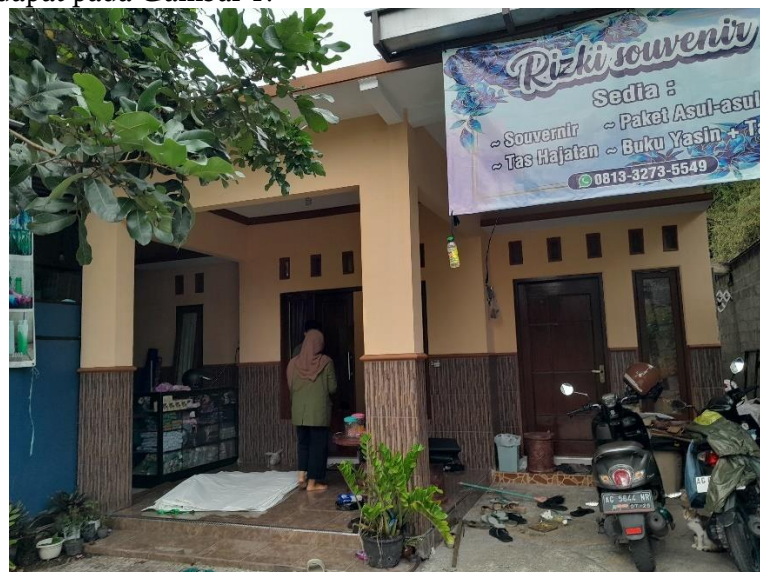
Gambar 1. Pembagian Undangan Kepada UMKM.

Dampak dari kegiatan penyuluhan yaitu meningkatkan pengetahuan warga Klampok tentang pentingnya wirausaha dalam meningkatkan ketahanan ekonomi di wilayah Klampok serta untuk pengembangan usaha yang cepat dan mudah serta memfasilitasi pinjaman untuk membiayai usaha dan diharapkan dapat berkelanjutan. Pelaksanaan Kegiatan Pembuatan NIB dilakukan dengan cara membagi undangan sebelum hari pelaksanaan pembuatan NIB kemudian kami mendatangi satu-persatu UMKM dengan mengacu pada peta UMKM yang telah kami buat, terdapat pada Gambar 1.