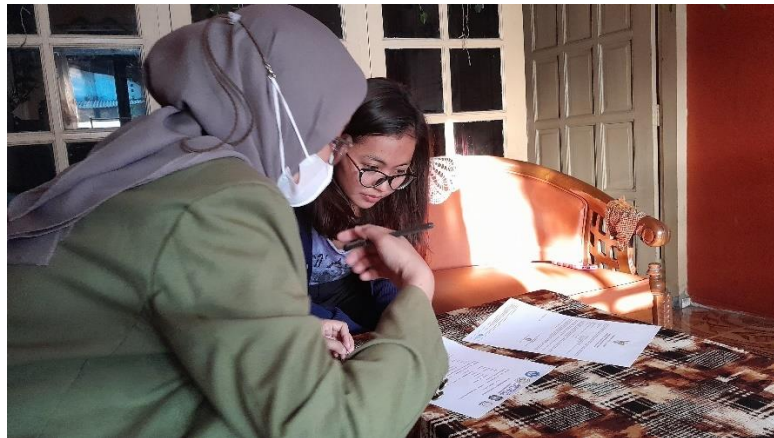
Gambar 4. Pelaksanaan Nomor Induk Berusaha di rumah pelaku UMKM.