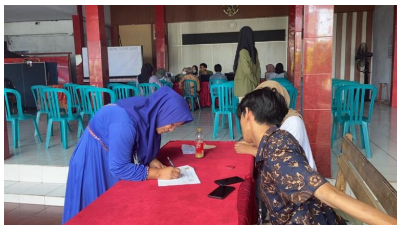
Gambar 3. Pelaksanaan Proses Pembuatan NIB di Kelurahan.

Tahap selanjutnya kami melakukan persiapan pada tempat dan melakukan pengecekan kembali pada peralatan yang dibutuhkan kemudian melanjutkan pada kegiatan Pembuatan NIB, pelaksanaan dapat dilakukan pada Kelurahan Klampok dan ada juga yang kami datangi di tempat pengelola UMKM. Pembuatan NIB dilakukan dengan cara membuat akun website OSS dengan mengisi data-data perusahaan, pemegang saham, kepemilikan modal, nilai investasi dan rencana penggunaan tenaga kerja, termasuk tenaga kerja asing. Jika pelaku usaha menggunakan tenaga kerja asing, maka pelaku usaha menyetujui pernyataan penunjukan tenaga kerja pendamping serta akan menyelenggarakan pendidikan dan pelatihan atau dengan output surat pernyataan, selanjutnya setelah melakukan pengajuan data usaha, kami menunggu beberapa saat untuk proses verifikasi data dan menunggu terbitnya sertifikat NIB. Setelah selesai setiap NIB diperiksa ulang dan dievaluasi untuk verifikasi mengembalikan jika terjadi kesalahan saat memberikan informasi data dan memasukkan data. NIB yang lengkap kemudian diberikan kepada pelaku UMKM, NIB yang sudah tercetak akan diberikan kepada pelaku UMKM di tempat dan juga di rumah masing-masing pelaku UMKM dapat dilihat pada Gambar 3, Gambar 4 dan Gambar 5.