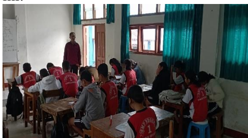
Gambar 3. Uji Coba Kelompok Besar

Berdasarkan hasil analisis, diketahui bahwa persentase ketuntasan hasil belajar siswa setelah menggunakan bahan ajar matematika materi segiempat berbasis etnomatematika rumah adat Manggarai adalah 83,3%. Hal ini kemudian dikonversi sehingga memperoleh kriteria efektif. Hasil analisis kepraktisan dan keefektifan pada uji coba kelompok besar, bahan ajar yang digunakan tidak mengalami perubahan sehingga DRAFT C ini dinyatakan valid. Hasil analisis DRAFT C yang dinyatakan valid, praktis dan efektif ini dinamakan DRAFT FINAL yang merupakan produk akhir dari penelitian ini.