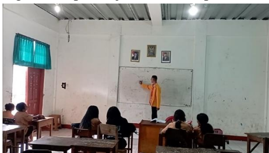
Gambar 2. Uji Coba Kelompok Kecil

dinamakan DRAFT C yang akan digunakan pada uji coba kelompok besar.