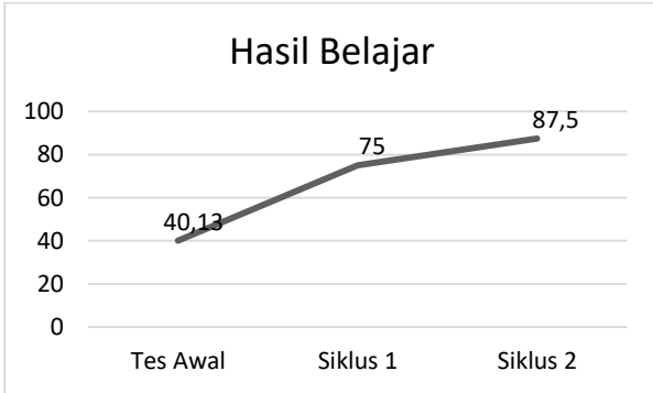
Gambar 1. Hasil Belajar siswa

Berdasarkan gambar 1 ini terlihat bahwa ada peningkatan rata-rata hasil belajar dari 75 pada siklus 1 dengan ketuntasan klasikal 77,33% (22 siswa) menjadi rata-rata hasil belajar 87,5 dengan ketuntasan klasikal 100% (30 siswa) pada siklus 2. Hal ini disebabkan siswa termotivasi menggunakan alat peraga untuk memahami persoalan yang diberikan sebagaimana pendapat Heinich (Hartoyo, 2006) yang mengatakan bahwa alat peraga memberi kesempatan kepada siswa untuk belajar dari tangan pertama, untuk menyentuh, mengamati, bereksperimen, bertanya dan menentukan.