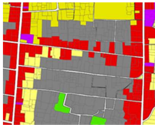
Gambar 1. Peta eksisting tata guna lahan kampung Prawirotaman, dianalisis dari RTBL Prawirotaman, 2015-2020

fungsi komersial (Kementerian Pekerjaan Umum Direktorat Cipta Karya, n.d.). Fungsi komersial tersebut terbagi menjadi beberapa jenis diantaranya hotel atau guesthouse , café , travel , pasar dan toko (Pemerintah Kota Yogyakarta 2015). Hotel dan guesthouse mempunyai jumlah yang cukup signifikan di kampung ini. Hal ini sejalan dengan image Kampung Prawirotaman sebagai Kampung Turis sehingga menjamurnya hotel dan guesthouse di kawasan ini sulit untuk dihindari.