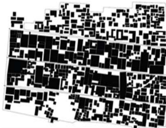
Gambar 4. Peta figure ground kampung Prawirotaman

Konfigurasi ruang erat kaitannya dengan massa padat/bangunan/ urban solid dan lubang/ruang terbuka/ urban voids . Ditunjukkan dengan peta hitam putih yang menunjukkan perbedaan antara massa bangunan dengan ruang terbuka.