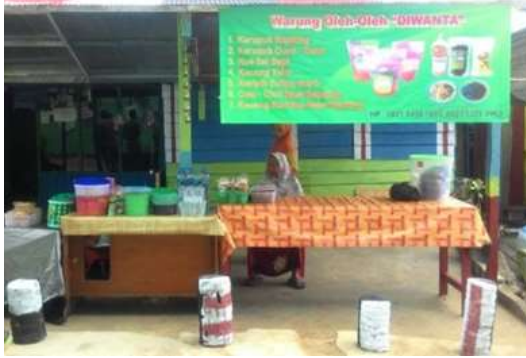
Gambar 5. Peluang bisnis di kampung Warna-warni Teluk seribu

Selain meningkatkan jumlah wisata lokal, kondisi kampung juga menjadi lebih cerah, serta dapat dijadikan peluang bisnis dari wisatawan dadakan yang berkunjung.