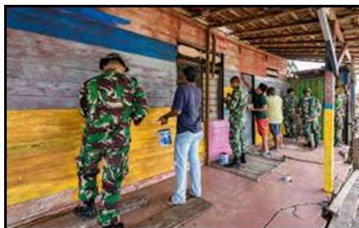
Gambar 3. Partisipasi masyarakat di kampung Warna-warni Teluk seribu, kota Balikpapan

Pelaksanaan dibagi menjadi dua tahap, yang pertama dilakukan dalam waktu \pm 7 hari dan berhasil menyelesaikan 10 rumah yang tercatat. Dalam pengerjaan tahap pertama hanya dilakukan oleh pihak pemerintah dan dibantu beberapa warga setempat. Untuk mencapai target penyelesaian, karena akan segera diresmikan maka pada tahap kedua pembangunan mulai di rencanakan dan dirancang dengan matang. Seluruh anggota Pokdarwis dan pihak pemerintah kota Balikpapan mulai membagi informasi pembangunan kampung Warna-warni melalui media masa dan sosial. Penyebaran informasi mendapatkan respon yang positif dari berbagai pihak, seperti Komunitas Pelukis Balikpapan yang terdiri dari 16 orang seniman/ pelukis, media masa KalTim Post dan Balikpapan Pos, pihak PT. Pertamina Balikpapan, masyarakat Balikpapan dari berbagai kalangan.