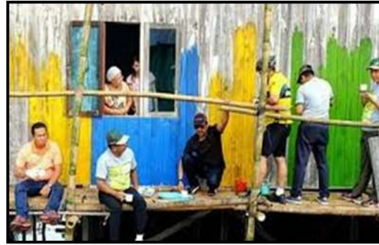
Gambar 10. Proses pengecatan rumah tinggal di kampung Warna-warni Teluk seribu, kota Balikpapan