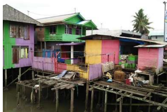
Gambar 12. Kondisi bangunan saat ini di kampung Warna-warni Teluk seribu, kota Balikpapan