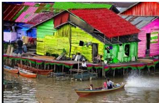
Gambar 4. Kondisi kampung nelayan, setelah berubah menjadi kampung Warna-warni Teluk seribu

Selain itu masih banyak lagi pihak-pihak yang berpartisipasi baik dalam bentuk tenaga maupun materi atau barang. Sehingga dalam pelaksanaan pembangunan tahap kedua hanya memerlukan waktu \pm 22 hari untuk menyelesaikan 225 rumah. Pada tahap pertama perhari hanya dapat menyelesaikan 1 – 2 rumah, sementara dipelaksanaan tahap kedua lebih cepat karena perharinya dapat menyelesaikan 10 – 11 rumah. Pembangunan yang dilakukan dalam waktu singkat, kurang lebih sebulan membawa dampak yang sangat besar terhadap pertumbuhan kampung Warna-warni. Perubahan kampung nelayan menjadi warna-warni menambah jumlah kunjungan wisata lokal. Tidak hanya dinding rumah, tetapi atap-atap rumah warga juga dihias dengan pelbagai warna cat yang mencolok.