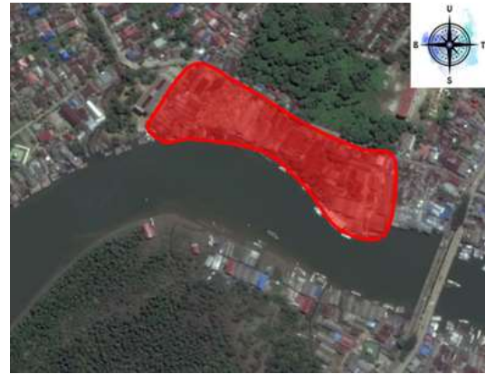
Gambar 7. Lokasi penelitian "kampung Warna-warni Teluk seribu" kota Balikpapan dianalisis dari citra satelit google earth

Secara administrasi pemerintahan kota Balikpapan, kampung Warna-warni Teluk Seribu berbatasan dengan Jl. Persatuan disebelah utara, Muara Sungai Manggar disebelah selatan, Pasar Manggar disebelah timur, dan Rusunawa Manggar tepat berada disebelah barat. Kampung Warna-warni Teluk Seribu berdiri didataran rendah yang sebagian besar kondisi tanahnya berupa pasir, dan sebagian bangunan rumah juga berada diatas permukaan air serta rawa. Bentuk bangunan atau rumah di kampung tersebut sangat dipengaruhi oleh kondisi alam kawasan tersebut, sewaktu-waktu air laut dapat naik ke atas permukaan kampung Warna-warni Teluk Seribu kota Balikpapan. Hubungan sosial warga kampung Warna-warni Teluk Balikpapan terjalin sangat erat. Hal tersebut terlihat dengan adanya kerja bakti lingkungan yang dilakukan diakhir pekan. Selain itu kerja sama dan gotong royong juga selalu terjadi disetiap kegiatan warga kampung Warna-warni Teluk Seribu.