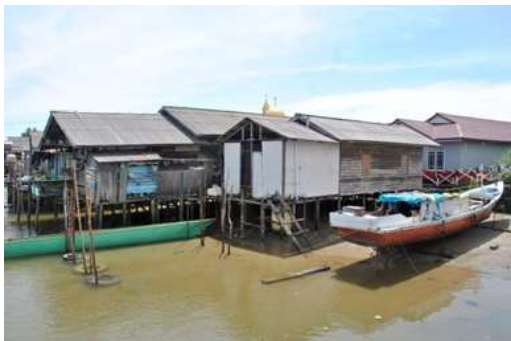
Gambar 1. Kondisi rumah warga di kampung nelayan sebelum pembangunan

Dari data tersebut maka dapat disimpulkan bahwa kampung Warna-warni Teluk Seribu kota Balikpapan dapat digolongkan sebagai permukiman kumuh. Dengan demikian permukiman tersebut menjadi target pemerintah kota Balikpapan dalam melaksanakan pembangunan melalui kebijakan atau program KOTAKU dengan pendekatan berbasis masyarakat. Dimana masyarakat atau sumber daya manusia menjadi elemen terpenting dalam pembangunan kampung Warna-warni Teluk Seribu guna mendukung atau berpartisipasi secara aktif agar pelaksanaannya cepat selesai. Sedangkan pemerintah daerah memiliki peran sebagai fasilitator atau nakhoda untuk menjembatani kebutuhan yang diperlukan serta mengarahkan masyarakat dalam pelaksanaan pembangunan.