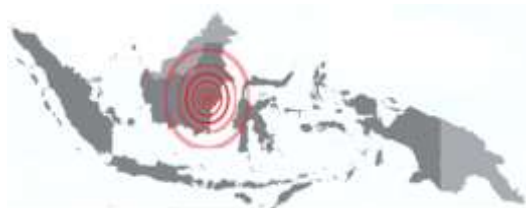
Gambar 6. Letak kota Balikpapan di peta Indonesia, dianalisis dari rupa bumi google earth

Kampung Warna-warni Teluk Seribu berada di sepanjang Muara Sungai Manggar, kota Balikpapan, provinsi Kalimantan Timur, kepulauan Kalimantan. Secara spesifik kampung tersebut terletak di Jl. Persatuan, kelurahan Manggar Baru, kecamatan Balikpapan Timur, dan terdiri dari 5 (lima) RT yaitu RT 3, 4, 13, 32, dan RT 39.