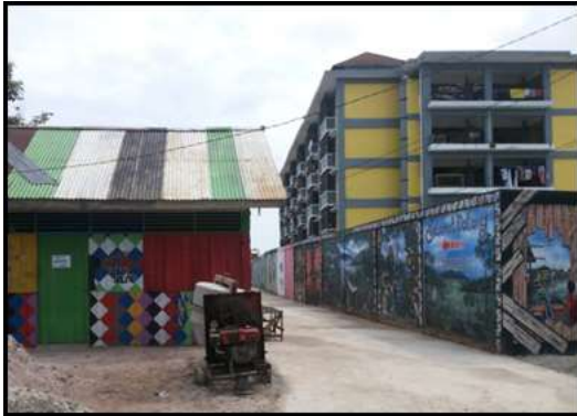
Gambar 8. Jalur utama di kampung Warna-warni Teluk seribu, kota Balikpapan

dan membuat beberapa karya lukisan yang berada di jalur utama serta menjadi salah satu bagian objek wisata kampung Warna-warni menjadi rusak sebelum dapat diselesaikan. Hal tersebut membuat para seniman bekerja ulang untuk memperbaiki karya mereka serta bekerja ekstra untuk menyelesaikan karya mereka sebelum peresmian kampung Warna-warni Teluk Seribu.