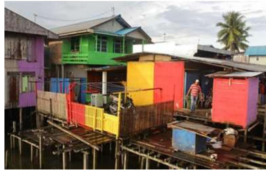
Gambar 11. Kondisi bangunan saat baru selesai proses pengecatan di kampung Warna-warni Teluk seribu, kota Balikpapan