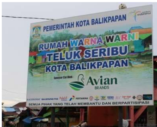
Gambar 2. Sponsor kampung Warna-warni Teluk seribu, kota Balikpapan

Rencana awal dari bantuan cat yang disalurkan dapat mencapai target 200 rumah yang akan dicat, ternyata hingga peresmian dilakukan target tersebut meningkat 17.5%, dan total keseluruhan mencapai 235 rumah. Peningkatan tersebut merupakan bentuk partisipasi warga lokal yang tidak termasuk daftar penerimaan bantuan pemerintah. Warga tersebut menggunakan tenaga dan material pribadi.