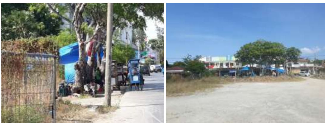
Gambar 4. Kondisi kawasan pantai dari jalan kolektor kota Kupang didokumentasi oleh Meldi, 2018