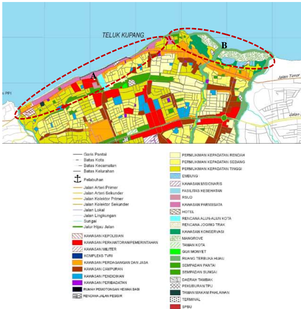
Gambar 3. Kondisi kawasan budidaya di BWK 2 kota Kupang direpro dari RTRW kota Kupang, 2011