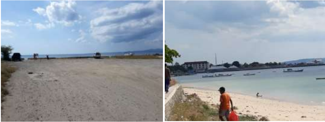
Gambar 5. Kondisi kawasan pantai kota Kupang didokumentasi oleh Meldi, 2018