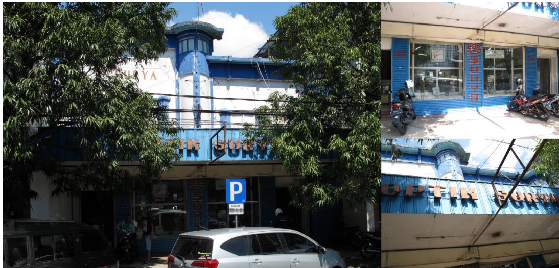
Gambar 4. Optik Surya

masyarakat arsitektur menilai jendela memiliki kualitas estetika terendah. Masyarakat nonarsitektur beserta masyarakat arsitektur berbeda ketika menilai kualitas estetika bentuk bangunan serta gaya arsitektur. (Lihat di tabel 8)