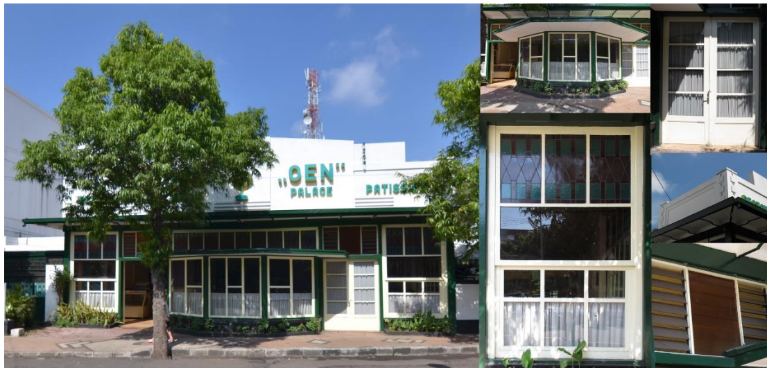
Gambar 3. Toko Oen

dinding dan material. Masyarakat nonarsitektur menilai dinding memiliki kualitas estetika terendah, tetapi menurut masyarakat arsitektur material memiliki kualitas estetika terendah. (Lihat di tabel 7)