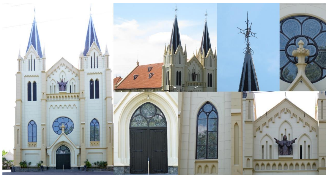
Gambar 2. Gereja Hati Kudus Yesus Malang

Masyarakat nonarsitektur beserta masyarakat arsitektur menilai gaya arsitektur memiliki kualitas estetika tertinggi pada Gereja Hati Kudus Yesus Malang. Ada perbedaan antara masyarakat nonarsitektur dan masyarakat arsitektur dalam penilaian terhadap kualitas estetika sembilan (75%) elemen arsitektural. (Lihat di tabel 6)