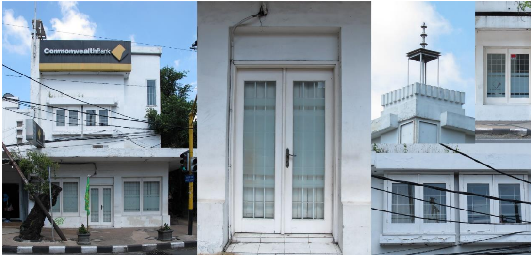
Gambar 5. Bank Commonwealth

rendah, tetapi menurut masyarakat arsitektur material memiliki kualitas estetika terendah. Hasil analisis menunjukkan masyarakat nonarsitektur dengan masyarakat arsitektur berbeda penilaian tentang material. (Lihat di tabel 9)