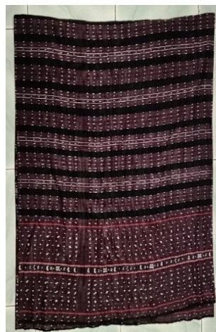
Gambar 5. Sarung Nowing

Dalam pertunjukan Tari Belo Baja Penari pria mengenakan Nowing (Sarung Tenun Pria), Kedewak (Ikat Pingang), kain merah dan kuning. Sedangkan penari wanita mengenakan Kewatek (Sarung Tenun Wanita), Selendang, Stagen, kain merah dan kuning.