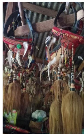
Gambar 6. Kedewak