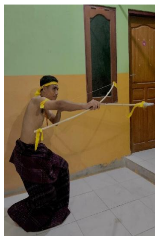
Gambar 1. Gerak Le'ong (Memanah)

Tari Belo Baja merupakan salah satu tarian tradisional yang memiliki beragam gerakan. Gerak merupakan substansi atau elemen dasar tari (Pekerti, 2002). Gerak adalah sesuatu yang terungkap secara spontan dalam penciptakannya. Gerak dalam Gerakan dalam tari Belo Baja memiliki ciri khas yang membedakannya dari tarian tradisional lainnya. Penari pria dari kelompok Demo melakukan gerak memanah dan kelompok Paji melakukan gerak menembak. Gerak memanah dan menembak dilakukan oleh kedua kelompok penari pria dari awal pertunjukan hingga pertengahan. Pada akhir pertunjukan kedua kelompok penari pria melakukan gerakan merangkul, menyembah, memohon dan bergandengan tangan. Selain penari pria, penari wanita juga melakukan beragam gerak yang penuh anggun dan penuh makna yang mencerminkan karakteristik dan nilai-nilai budaya perempuan lamaholot. Berikut klasifikasi gerakan penari pria dan wanita dalam Tari Belo Baja .