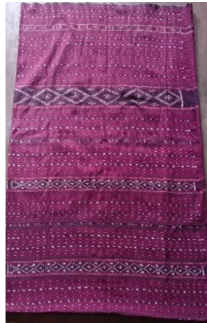
Gambar. 7 Kewatek

Menurut Yisrianamula (2015) aksesoris merupakan penghias dan penunjang penampilan yang sesuai dengan karakter pribadi pemakainya. Dalam pertunjukan tari tradisional penari biasanya menggunakan aksesoris-aksesoris khas daerah pemilik tarian tersebut. Selain menambah keindahan penampilan, juga mempunyai simbol dan makna mendalam bagi masyarakat setempat. Aksesoris yang dipakai untuk menambah keindahan penampilan penari Tari Belo Baja yaitu aksesoris-aksesoris tradisional yang menjadi budaya dan ciri khas masyarakat Desa Ratulodong. Aksesoris yang dipakai dalam Tari Belo Baja yaitu Nile (Kalung), Belao (Anting), Kala Bala (Gelang Gading), Kiri Manuk Tolo' Bura (Sisir yang dihiasi bulu ayam putih).