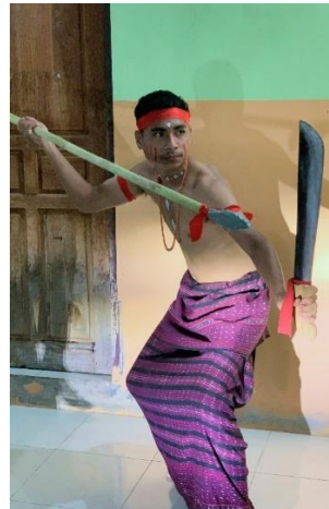
Gambar 2. Gerak Tubak Gala (Menembak)

panah di depan dada menggambarkan kesiapan melepas anak panah untuk menyerang musuh. Posisi kaki yang sedikit ditekuk memberikan kekuatan dan kesiapan untuk bergerak menyerang musuh.