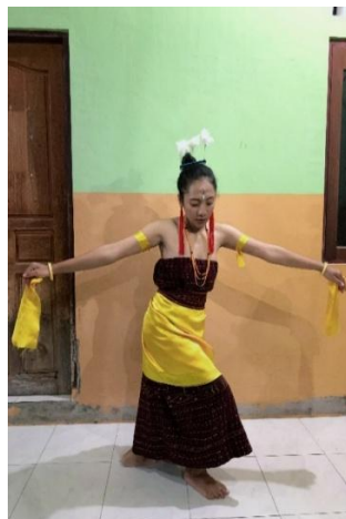
Gambar 3. Gerak Bergandengan Tangan

Setelah itu penari melakukan gerakan tangan sebanyak dua kali ke depan dan dua kali ke samping. Gerakan kaki yang menyertai gerakan tangan tersebut melibatkan langkah-langkah halus dan terkoordinasi yang mendukung kelancaran perpindahan posisi penari dalam pola lantai. Gerak kaki dilakukan dengan cara melangkah secara halus dan lembut ke samping dalam posisi tetap harmonis dan sinkron dengan gerakan tangan. Gerakan tersebut dilakukan secara serentak oleh kedua kelompok penari wanita, sambil bergerak membentuk pola lantai setengah lingkaran. Gerakan tersebut menunjukkan keharmonisan dan keselarasan antar penari, yang memperkuat estetika pertunjukan secara keseluruhan. Gerakan yang terakhir penari bergerak sambil bergandengan tangan dengan langkah kaki selangkah ke kanan lalu disilangkan ke depan dalam posisi kaki yang sedikit ditekuk. Gerakan tersebut diulang secara berkelanjutan sambil mengelilingi area, diiringi musik dengan tempo sedang. Selanjutnya, musik dipercepat dan penari bergerak mengelilingi dengan cepat mengikuti irama musik.